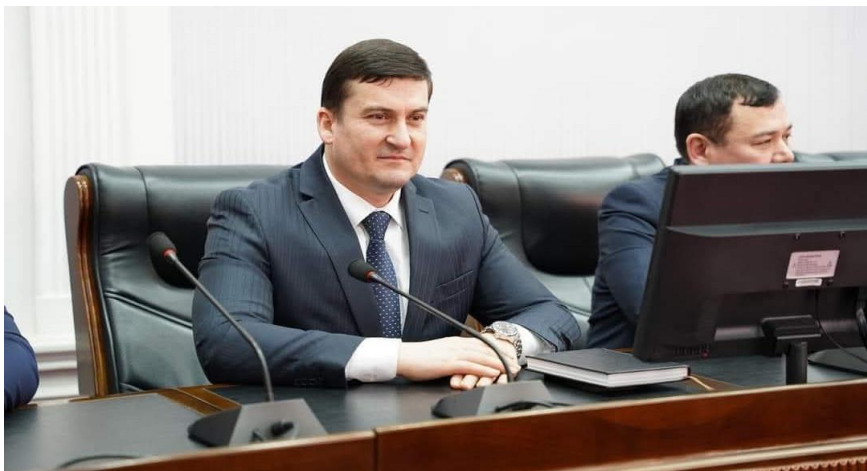
Иштироки Хушвахтзода Қ.Х. – Президенти Академияи миллии илмҳои Тоҷикистон дар ҷаласаи ғайринавбатии Шурои ҷамъиятии Ҷумҳурии Тоҷикистон дар бораи интихоби номзад ба вазифаи Котиб-ҳамоҳангсои Шурои ҷамъиятии Ҷумҳурии Тоҷикистон Шодиён И.Р., марти 2024, ш.Душанбе