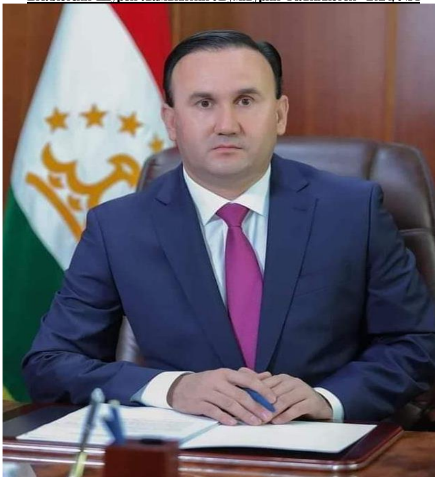
РАҲМОНЗОДА АБДУЛЛО ҚУРБОНАЛӢ – ЁРДАМЧИИ ПРЕЗИДЕНТИ ҶУМҲУРИИ ТОҶИКИСТОН ОИД БА МАСЪАЛАҶОИ РУШДИ ИЛТИМОӢ ВА РОБИТА БО ЉОМЕА, НАМОЯНДАИ ВАКОЛАТДОРИ ПРЕЗИДЕНТИ ҶУМҲУРИИ ТОҶИКИСТОН ДАР ШУРОИ ҶАМӢЯТИИ ҶУМҲУРИИ ТОҶИКИСТОН